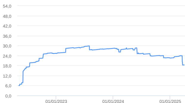
Patrimônio Líquido (R$ Milhões) - 06/05/2022 a 31/03/2025 (diária)