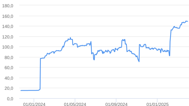
Patrimônio Líquido (R$ Milhões) - 22/11/2023 a 31/03/2025 (diária)