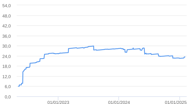
Patrimônio Líquido (R$ Milhões) - 06/05/2022 a 31/01/2025 (diária)