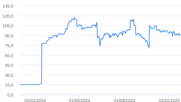
Patrimônio Líquido (R$ Milhões) - 22/11/2023 a 31/01/2025 (diária)