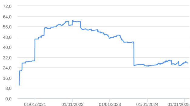
Patrimônio Líquido (R$ Milhões) - 30/07/2020 a 31/01/2025 (diária)