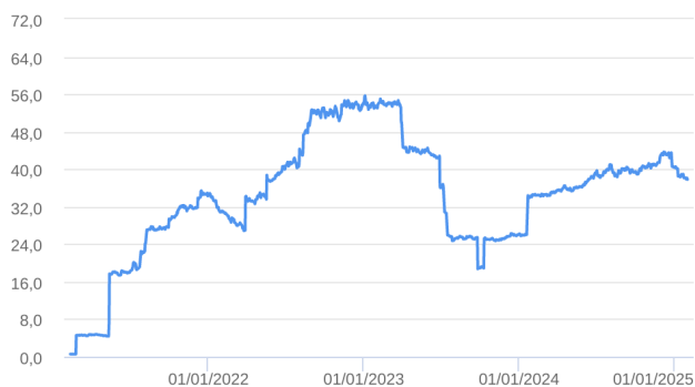
Patrimônio Líquido (R$ Milhões) - 10/02/2021 a 31/01/2025 (diária)