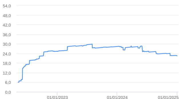
Patrimônio Líquido (R$ Milhões) - 06/05/2022 a 31/12/2024 (diária)