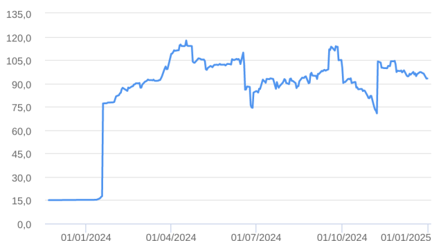
Patrimônio Líquido (R$ Milhões) - 22/11/2023 a 31/12/2024 (diária)