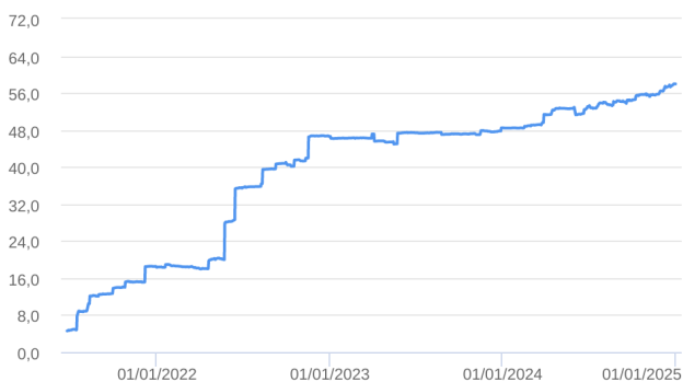
Patrimônio Líquido (R$ Milhões) - 25/06/2021 a 31/12/2024 (diária)