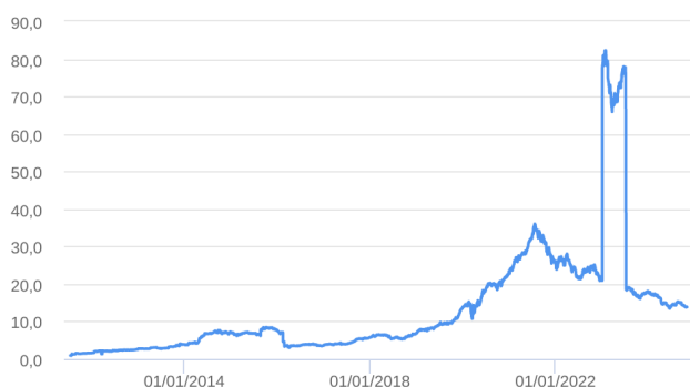
Patrimônio Líquido (R$ Milhões) - 19/07/2011 a 31/10/2024 (diária)