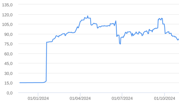
Patrimônio Líquido (R$ Milhões) - 22/11/2023 a 31/10/2024 (diária)