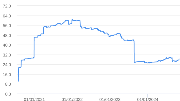
Patrimônio Líquido (R$ Milhões) - 30/07/2020 a 31/10/2024 (diária)