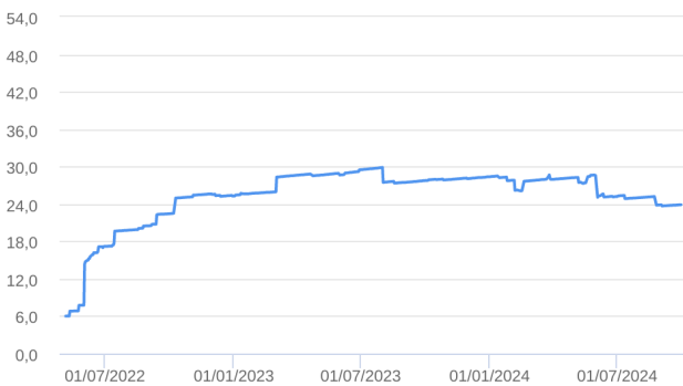
Patrimônio Líquido (R$ Milhões) - 06/05/2022 a 30/09/2024 (diária)