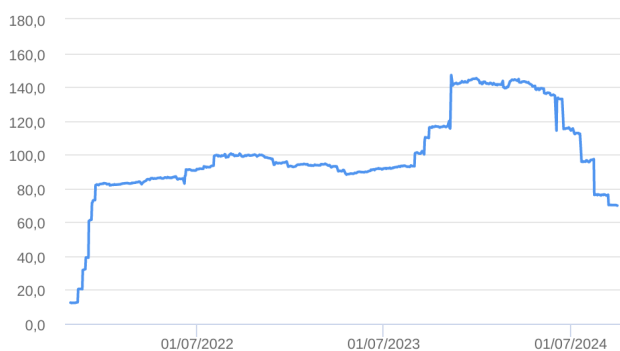
Patrimônio Líquido (R$ Milhões) - 26/10/2021 a 30/09/2024 (diária)