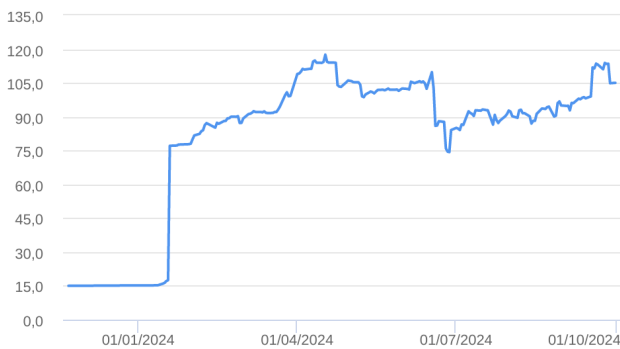
Patrimônio Líquido (R$ Milhões) - 22/11/2023 a 30/09/2024 (diária)