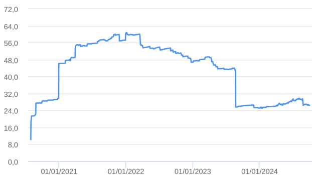
Patrimônio Líquido (R$ Milhões) - 30/07/2020 a 30/09/2024 (diária)