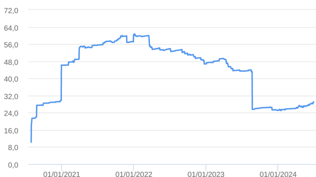
Patrimônio Líquido (R$ Milhões) - 30/07/2020 a 28/06/2024 (diária)