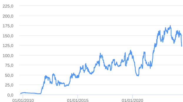
Patrimônio Líquido (R$ Milhões) - 15/10/2009 a 28/06/2024 (diária)