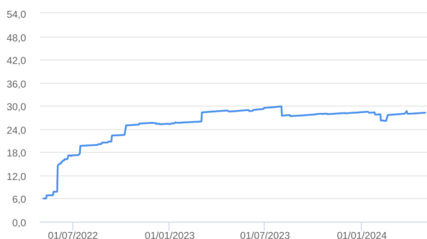
Patrimônio Líquido (R$ Milhões) - 06/05/2022 a 30/04/2024 (diária)