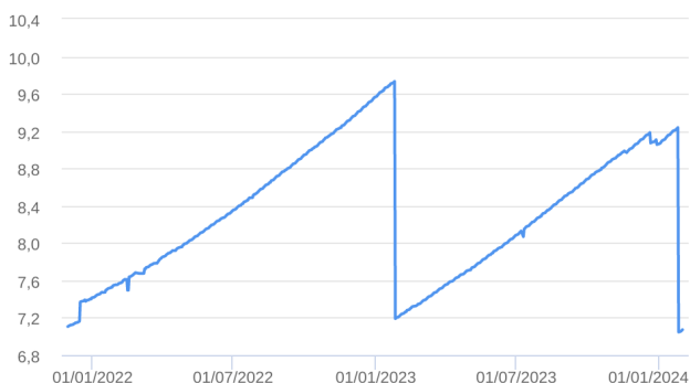
Patrimônio Líquido (R$ Milhões) - 30/11/2021 a 31/01/2024 (diária)