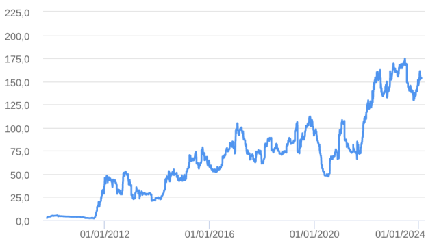
Patrimônio Líquido (R$ Milhões) - 15/10/2009 a 31/01/2024 (diária)