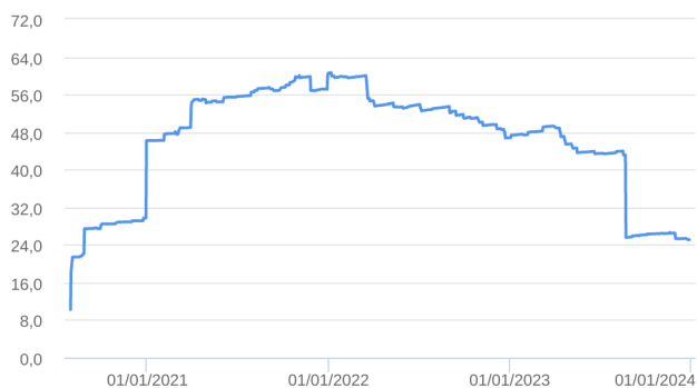
Patrimônio Líquido (R$ Milhões) - 30/07/2020 a 29/12/2023 (diária)