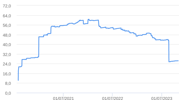
Patrimônio Líquido (R$ Milhões) - 30/07/2020 a 31/10/2023 (diária)