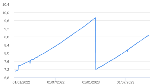
Patrimônio Líquido (R$ Milhões) - 30/11/2021 a 31/10/2023 (diária)