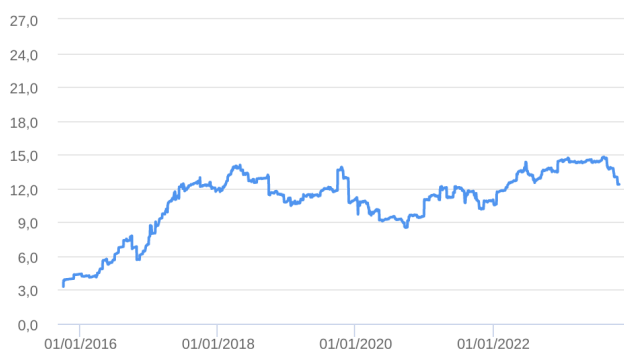
Patrimônio Líquido (R$ Milhões) - 01/10/2015 a 31/10/2023 (diária)