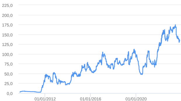
Patrimônio Líquido (R$ Milhões) - 15/10/2009 a 31/10/2023 (diária)